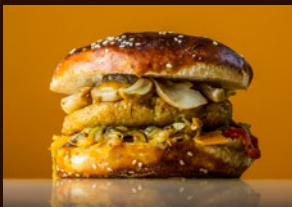
Roseg Burger Laugenbrötli