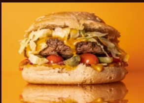
Lunghin Burger Vollkornbrötli