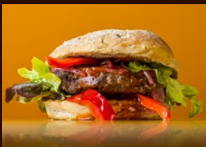
Margna Burger Vollkornbrötli